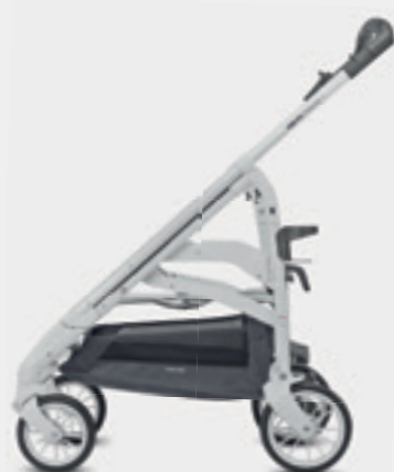
Telaio City Silver/Bianco Silver/White City Chassis