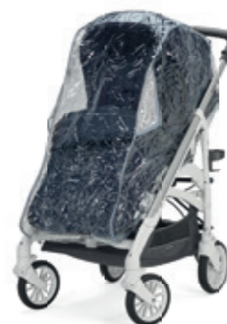
Parapioggia per passeggino Rain Cover for stroller