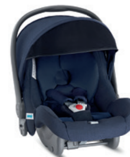
Seggiolino Auto Huggy Multifix 0+ Infant Car seat Huggy Multifix 0+