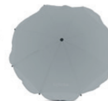
Ombrellino parasole Parasol Colors: Silver - Red - Light Blue - Green - Fuxia - Blue - Black