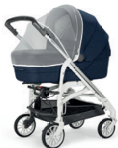
Zanzariera per carrozzina Mosquito net for pram