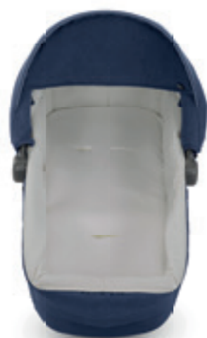
Rivestimento per materassino culla Pram mattress cover