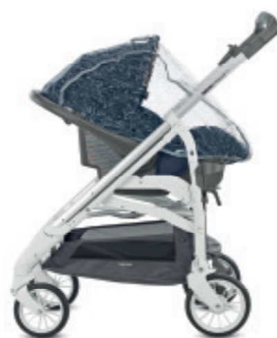
Parapioggia per seggiolino auto Infant Rain cover for Infant car seat