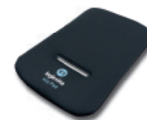
Ally Pad – dispositivo anti abbandono per culla predisposte auto e seggiolini auto Inglesina Ally Pad - car seat baby alert for car-compatible carrycots and car seats by Inglesina