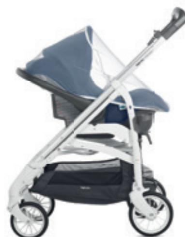
Zanzariera per seggiolino auto Infant Mosquito net for Infant car seat