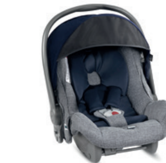
Seggiolino Auto Huggy Multifix 0+ Infant Car seat Huggy Multifix 0+