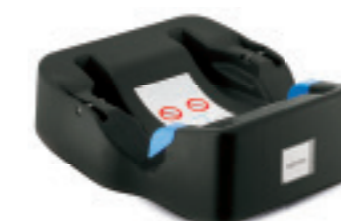
Base SHP per Huggy Multifix SHP Base for Huggy Multifix