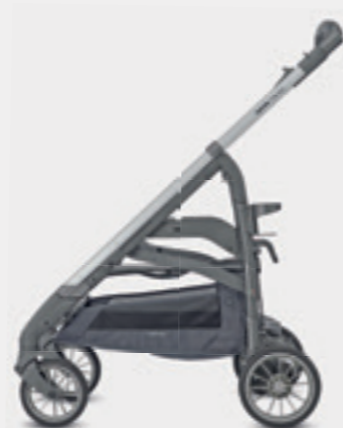
Telaio Standard (abbinato solo ai passeggini Trilogy) Standard Chassis (for Trilogy strollers only)