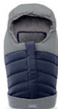
Newborn Winter Muff per culla e seggiolini auto scopri tutte le varianti a pagina 108 Newborn Winter Muff for carrycot and car seats discover the colour range on page 108