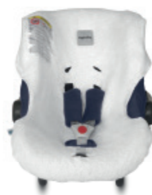
Summercover per seggiolino auto Infant Summercover for Infant car seat