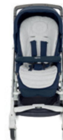
Baby Snug Pad - Cuscino riduttore per passeggino Baby Snug Pad - Stroller adapter