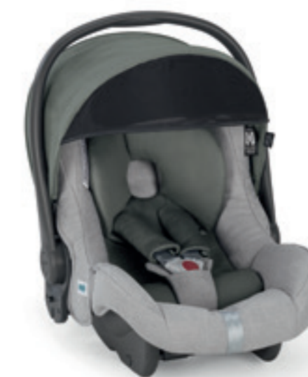
Seggiolino Auto Huggy Multifix 0+ Infant Car seat Huggy Multifix 0+