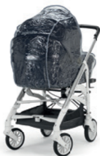
Parapioggia per carrozzina Rain Cover for carrycot