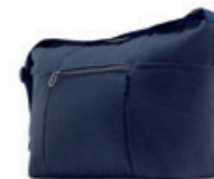
Borse Scopri i modelli e i colori a pagina 100 Bags Discover the colour range on page 100