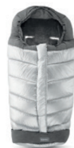
Sacco invernale Passeggino Scopri tutte le varianti a pagina 108 Stroller Winter Muff Discover the colour range on page 108