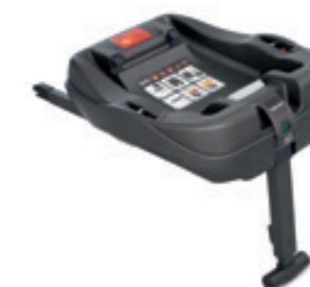
Base Isofix per Huggy Multifix Isofix Base for Huggy Multifix