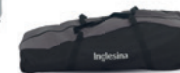
Borsa porta passeggino Stroller carry bag