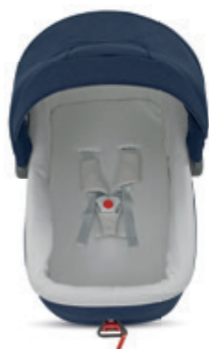
Kit Auto per culla Carrycot Kit Auto