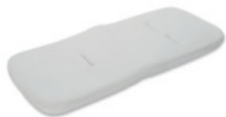
Materassino aggiuntivo culla Carrycot additional mattress