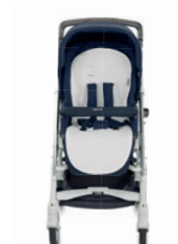
Summercover per passeggino Summercover for stroller